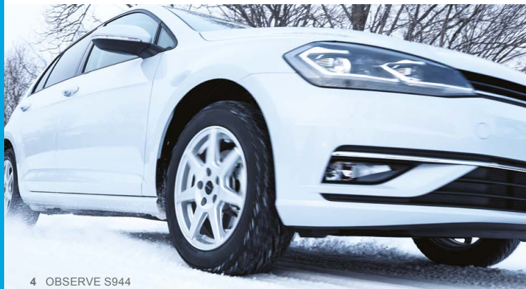
4 OBSERVE S944